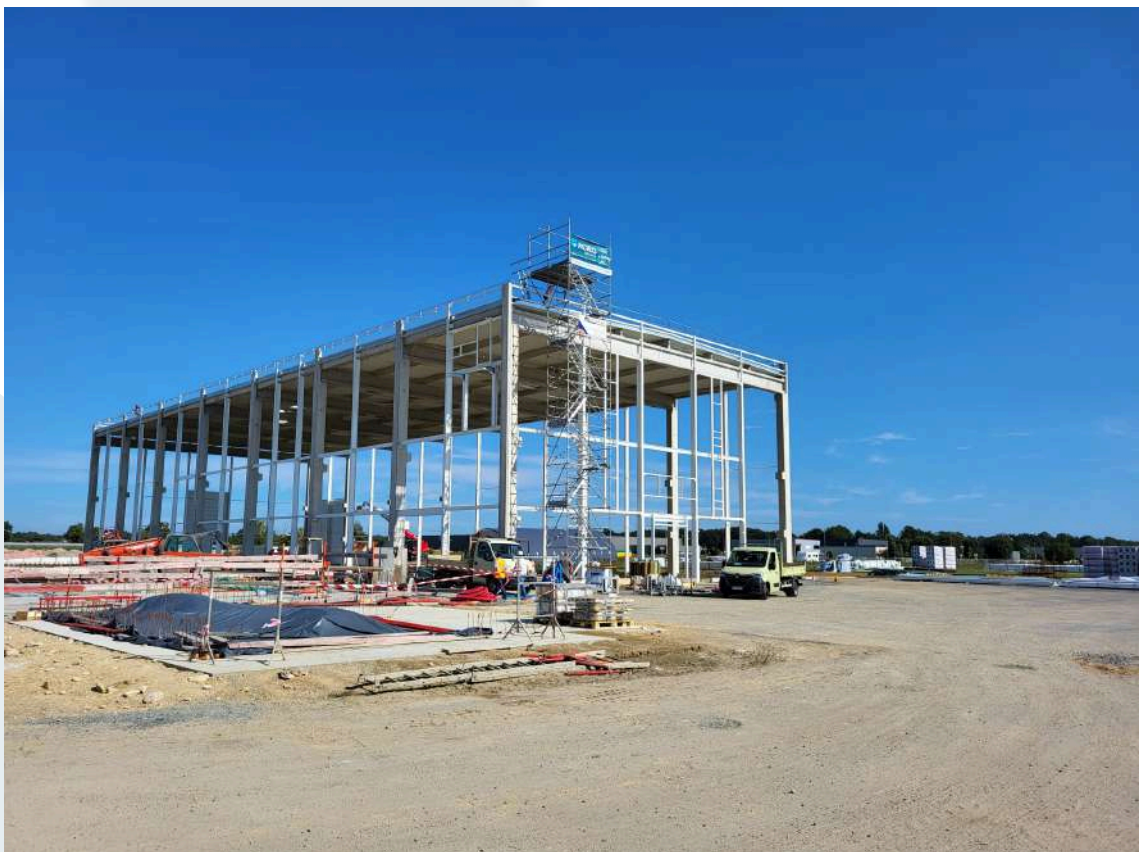
Station de Triage Multi-Grains - Longué-Jumelles (49) Charpente métallique / Métallerie / Bardage / Couverture

Investissements des collaborateurs, authenticité et simplicité dans les échanges en interne comme auprès des clients, mise en commun des connaissances, conseils sont tous partagés.