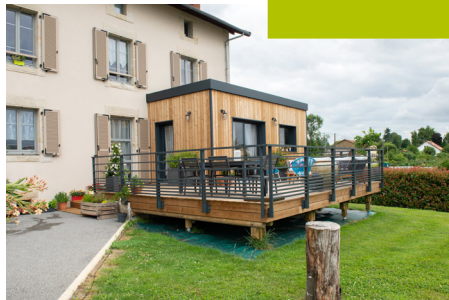
Extension de maison à Limoges