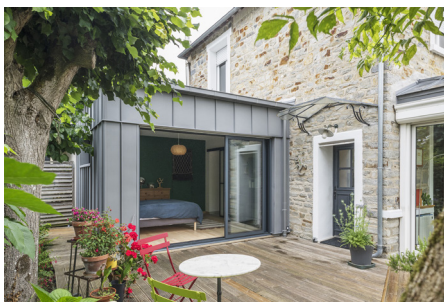
Extension de maison à Rennes