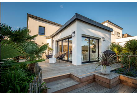
Extension de maison près de Quimperlé