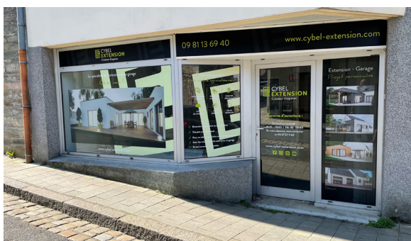
L'agence de Lannion

L'objectif de l'enseigne est d'ouvrir 3 agences fin 2022 pour atteindre une trentaine en 2023.