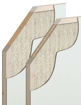
Panneau 30 dB

Lors de sa fermeture, la plinthe automatique , insérée dans la rainure basse, est actionnée par un déclencheur. La forme arrondie et souple de la plinthe calfeutre les interstices avec précision .