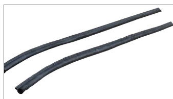
Joints isophoniques