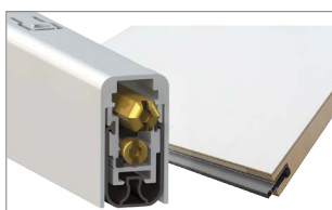
Plinthe automatique

Présentation presse en avant 1 ère de l'innovation Syntesis® Battant Acoustique ARCHITECT@WORK Nantes les 24 & 25 novembre 2022