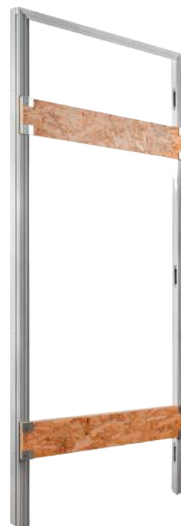
Chassis porte Syntesis® Battant